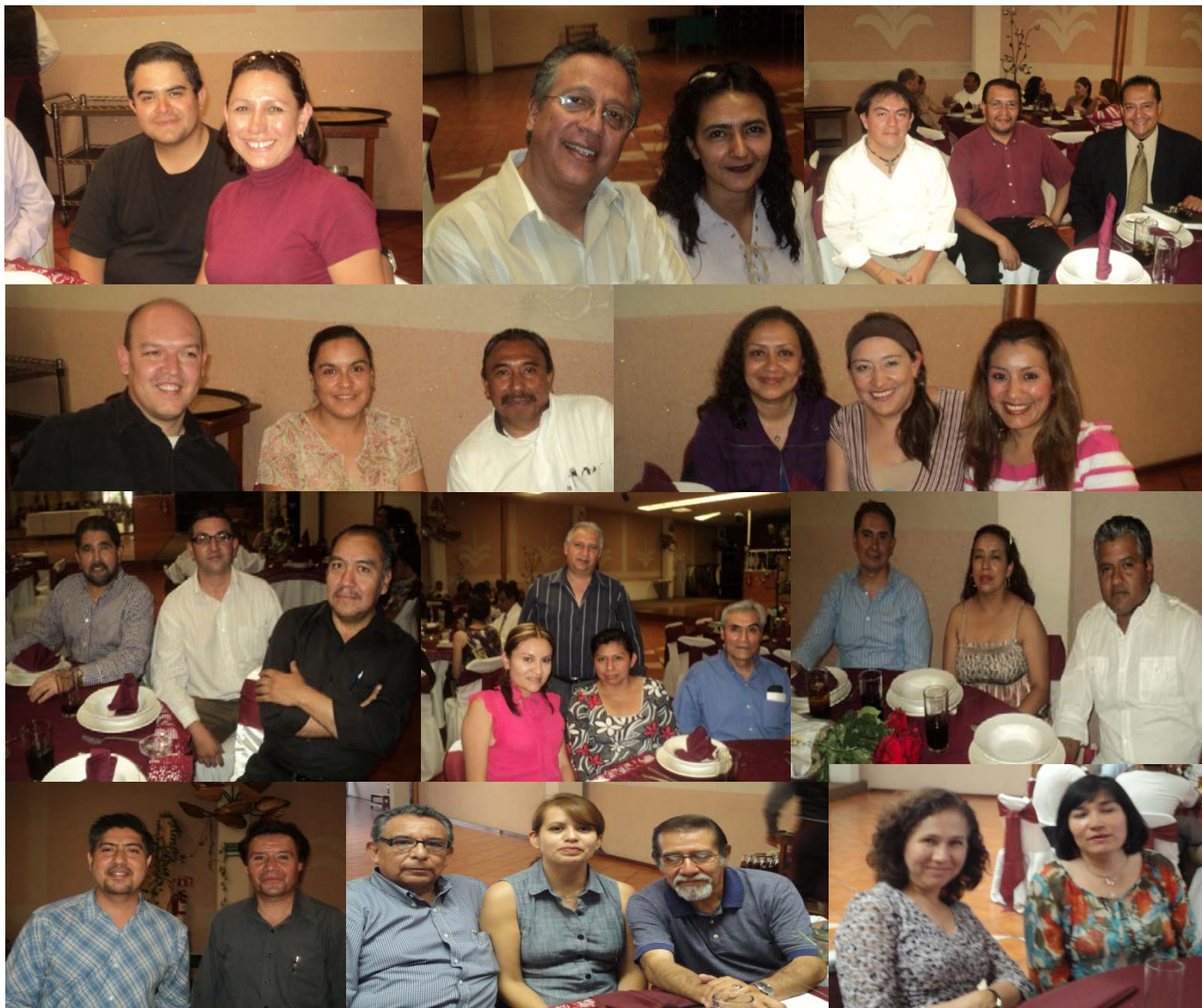
FOTO: Docentes del CEA en la comida del día del maestro.

CUMPLEAÑEROS DEL MES DE JUNIO ..... continúa Pág. 2