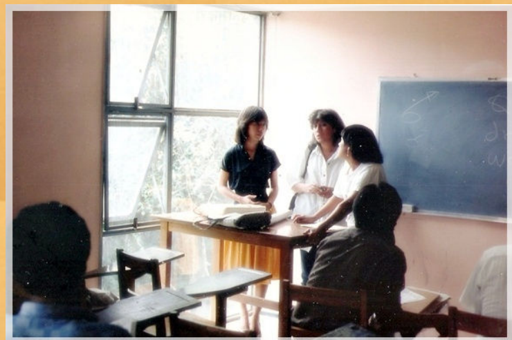
31° Aniversario CEA