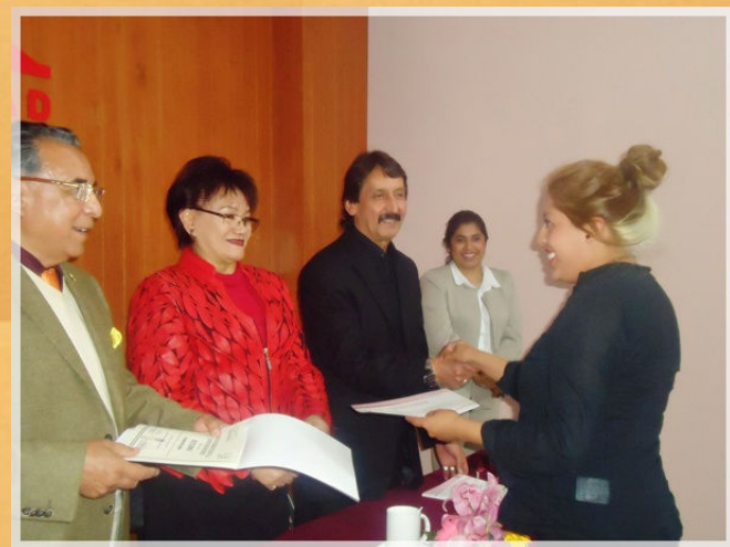
31° Aniversario CEA