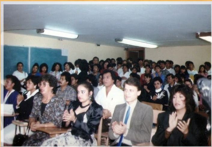
31° Aniversario CEA