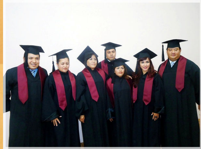
31° Aniversario CEA