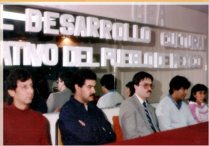
31° Aniversario CEA