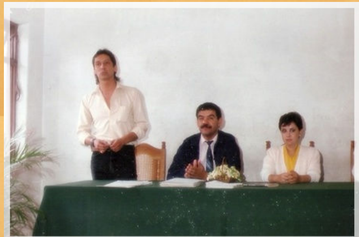
31° Aniversario CEA