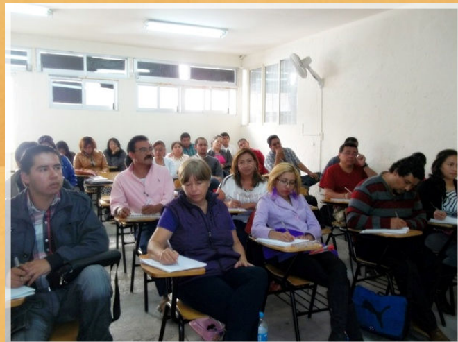
31° Aniversario CEA