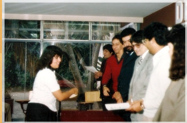
31° Aniversario CEA