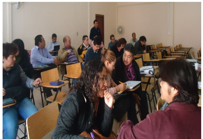
Discusión y análisis de los participantes.