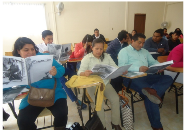
Alumnos asistentes leyendo la revista.