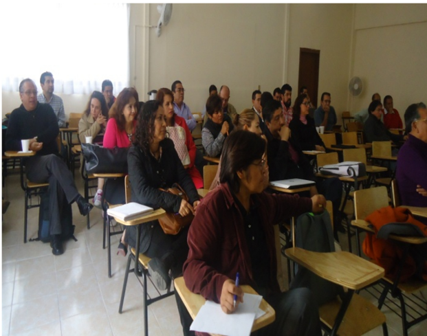
Excelente respuesta de todos los asesores.