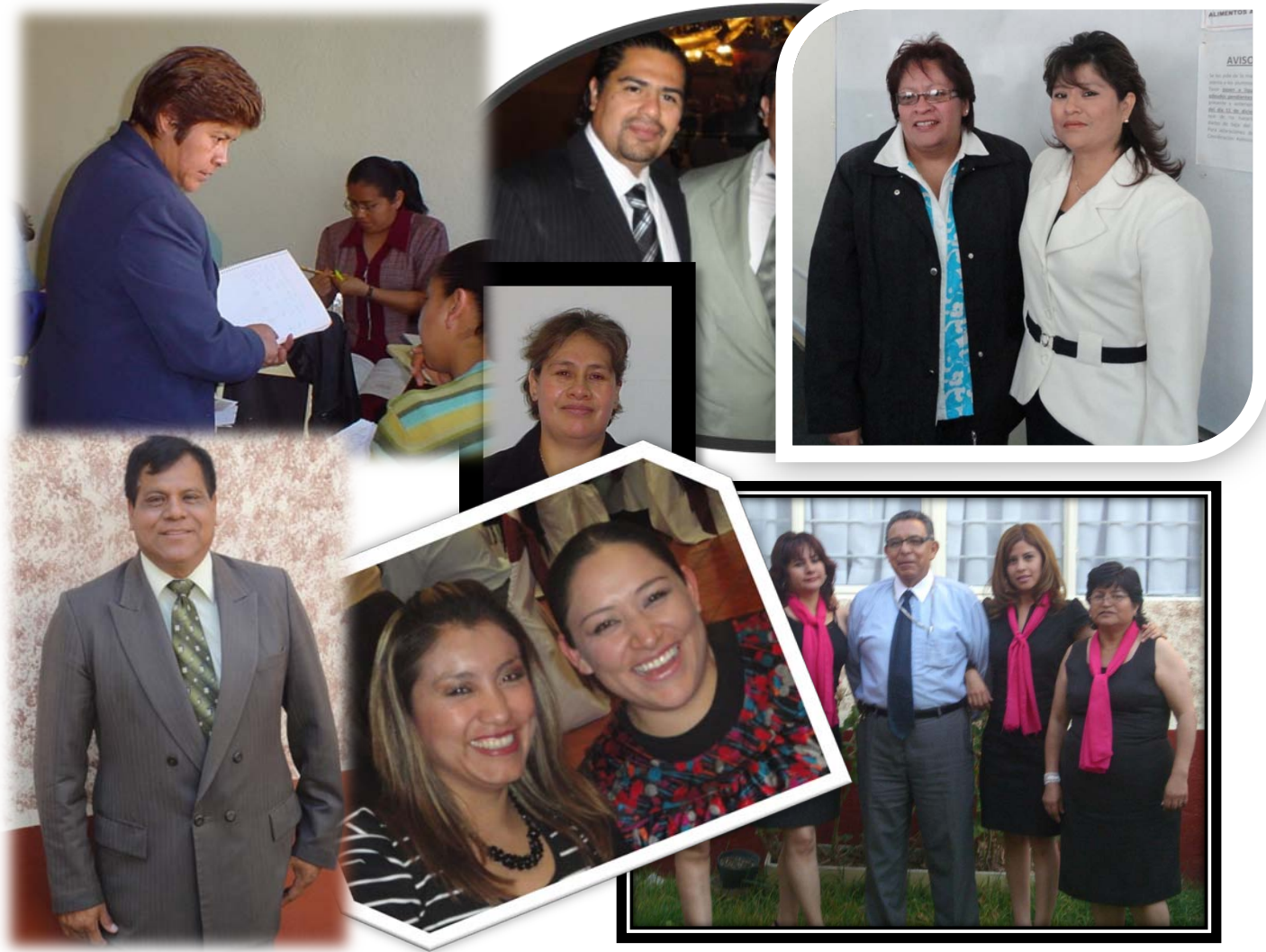
FOTO: Extraordinarios Docentes del CEA.

CUMPLEAÑEROS DEL MES DE MAYO ..... continúa Pág. 2 FECHAS IMPORTANTES DEL MES DE MAYO ..... continúa Pág. 3 RECOMENDACIONES CULTURALES ..... continúa Pág. 3 NO TE HABIÁS DADO CUENTA ..... continúa Pág. 6