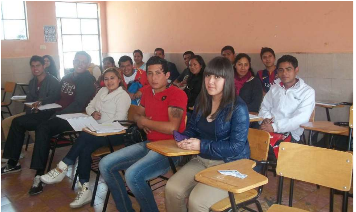
ALUMNOS DE BACHILLERATO DE NUEVO INGRESO