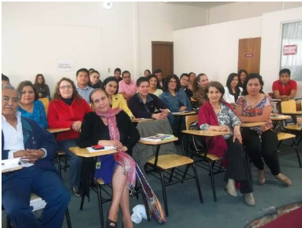
ALUMNOS LICENCIATURA EN DERECHO