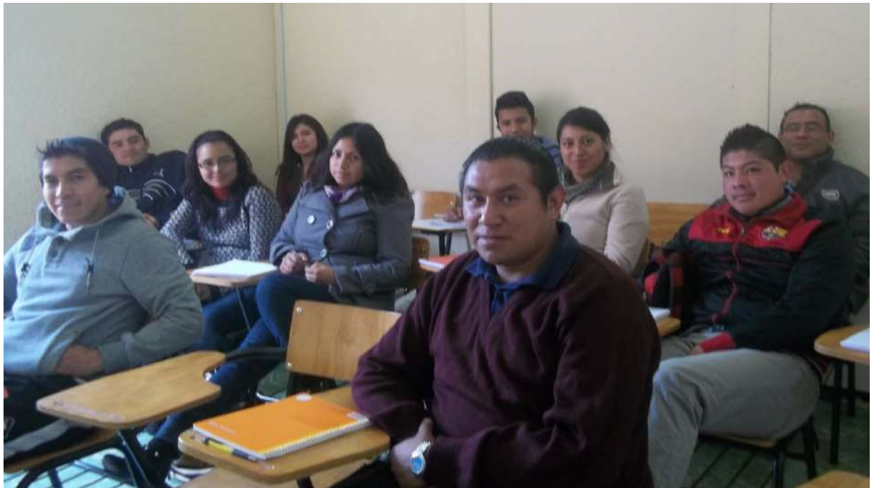
ALUMNOS DE LICENCIATURA EN CONTADURÍA