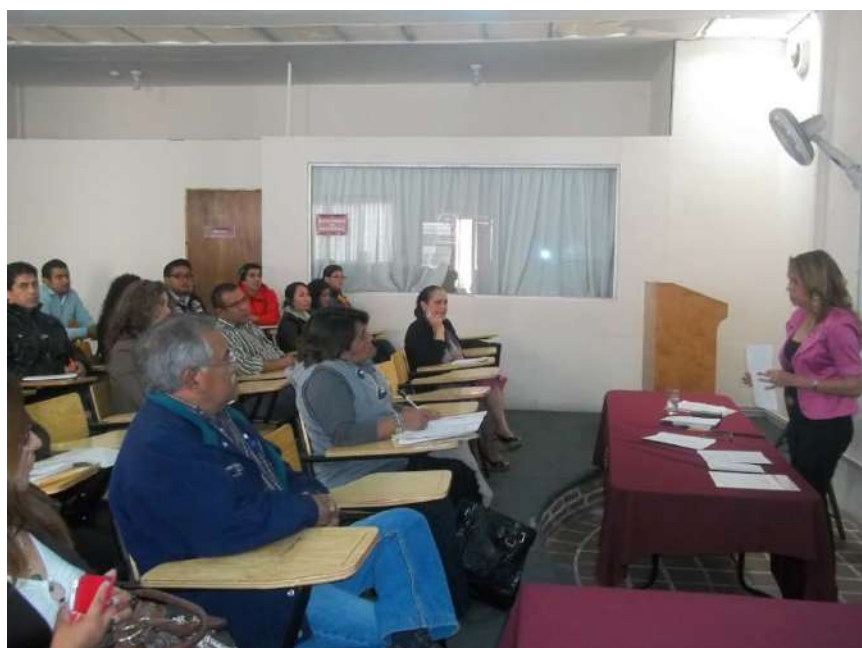
Aspecto general de la junta informativa con alumnos de nuevo ingreso.

Al final, también respondió dudas de todos los alumnos presentes, quienes estuvieron todo el tiempo muy atentos a todas las explicaciones de la titular del departamento de Control Escolar del CEA.