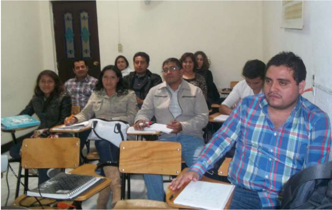
ALUMNOS DE LICENCIATURA EN ADMINISTRACIÓN