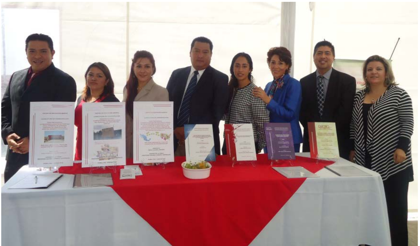
Alumnos expositores de la licenciatura de Administración.

Posteriormente, los asistentes pasaron a observar todos los carteles en donde cada uno de los expositores presentaron su anteproyecto de tesis, para luego degustar deliciosos bocadillos con un agradable fondo musical que hizo que alumnos y profesores, y público en general convivieran amablemente y pudieran constatar la labor realizada durante tanto tiempo por los futuros administradores. Felicidades por su evento, y mucha suerte en lo que resta de sus estudios.