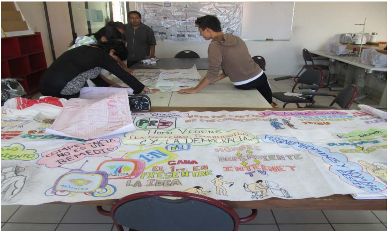
Equipo 2 de EDUCA Febrero 13 realizando Mapa Mental para exposición en Ciencias Políticas I.

Estos Organizadores Gráficos pueden ser entendidos, en primer lugar, como una “estrategia”, en la medida que ayudan a los alumnos a aprender y a los profesores a organizar el material de enseñanza; como un “método”, para ayudar a los alumnos y docentes a captar el significado de los materiales de aprendizaje, y finalmente, como un “recurso”, para representar esquemáticamente un conjunto de significados conceptuales (Ontoria: 1994, 65).