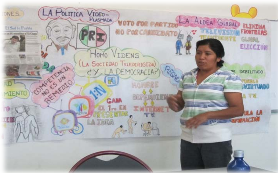
Alumna del grupo EDUCA Febrero 13 exponiendo su Mapa Mental para la clase de Ciencias Políticas I

Sin embargo, se hacen necesarias una serie de recomendaciones al momento de incorporar estas técnicas de aprendizaje a la planeación docente, en primer lugar, el docente debe modelar o ejemplificar él, o los Organizadores Gráficos de su preferencia al presentarlo por primera vez en su clase, es decir, debe explicar cómo se construye, cuáles son las partes que lo integran y para qué sirve, esto con la finalidad de que los alumnos desarrollen la habilidad de realizarlos. Posteriormente se debe proporcionar una cantidad razonable de información que le permita al estudiante seleccionar y categorizar los contenidos de su Organizador, así mismo debe permitir que se compartan los diferentes Organizadores Gráficos realizados en clase como un ejercicio de retroalimentación, ya que algunos Organizadores pueden enfatizar lo que otros no. También se hace necesario un espacio de reflexión donde el alumno diserte sobre cómo diseñar su Organizador , y por último, se evaluará tanto el proceso como el producto de la realización de los Organizadores Gráficos mediante una exposición que explique el contenido de los mismos.