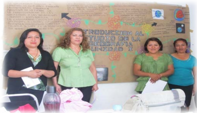
Equipo 1 Xochicalco Febrero 14 concluyendo la exposición de su tema plasmado en un Organizador Gráfico.

Por último, se puede decir que varias investigaciones muestran que el aprendizaje adquirido a través del desarrollo de estas habilidades confirman las bondades de su eficacia en los diferentes contenidos curriculares, donde se puede aplicar, no sólo en los adolescentes en edad de cursar el nivel medio superior, sino en personas de todas las edades (Campos: 2005, 13-21). Sin embargo, debe mencionarse, que la preferencia de optar por este tipo de estrategia visual depende no sólo de estilos de aprendizaje o tipo de inteligencia dominante, sino, también, del contexto cultural. Así que a darle compañeros.