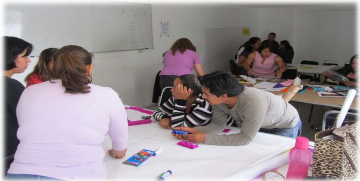
Xochicalco Febrero 14. En equipos elaborando sus Organizadores Gráficos para la materia de Geografía