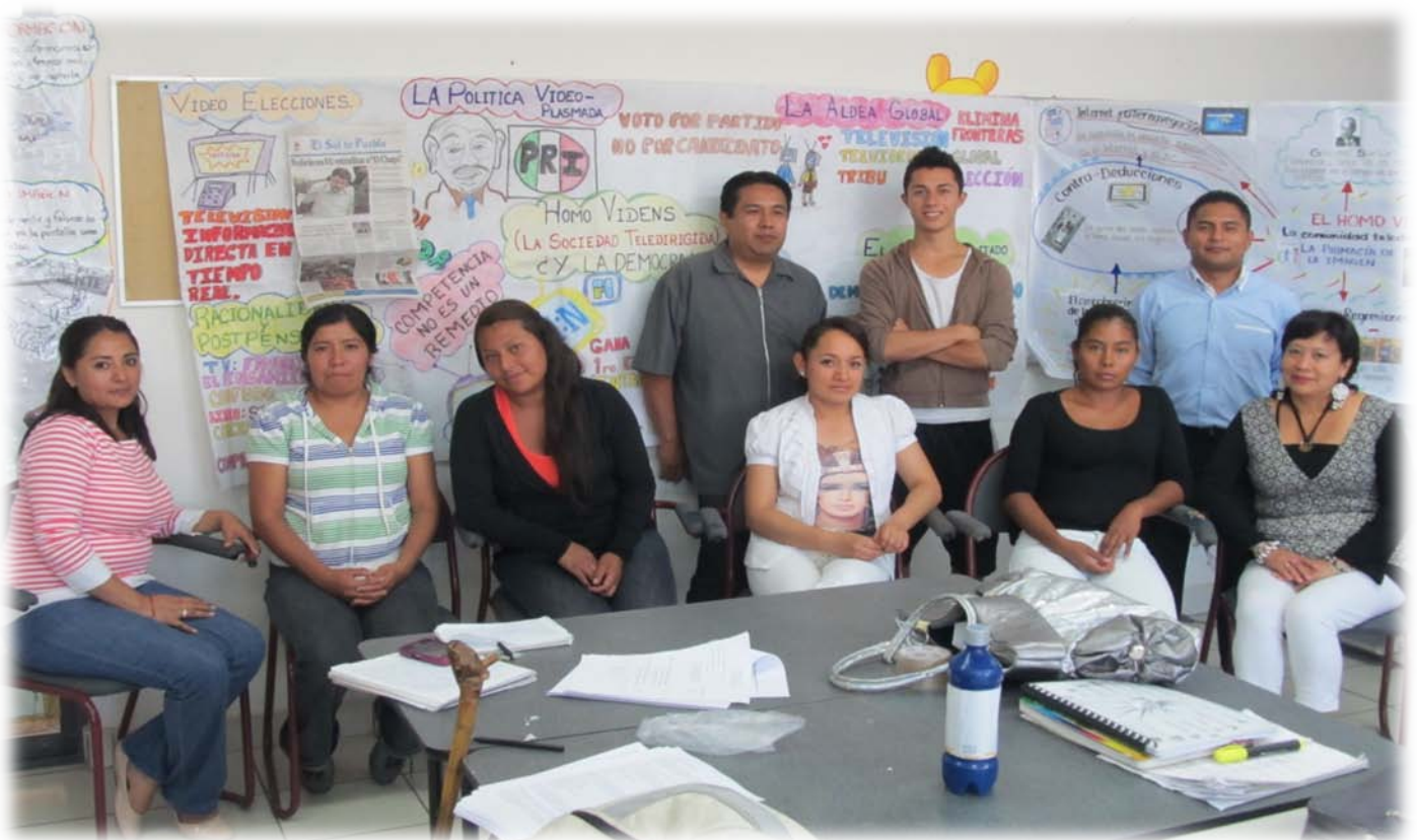
EDUCA Febrero 13 exhibiendo sus Organizadores Gráficos al final de la clase

Ahora bien, la verdadera importancia de utilizar estas herramientas cognitivas es que nos permite, a nosotros como docentes de un sistema de educación abierta, alfabetizar visualmente a todos aquellos estudiantes que se reincorporan al ámbito académico, ya que se puede afirmar que la representación del conocimiento en el proceso de aprendizaje de los alumnos se basa en que estas técnicas tienen sustento en los enfoques modernos de aprendizaje: cognitivista , por cuanto el alumno al elaborar los Organizadores construye significados o adquiere significados al analizarlos. Constructivista , al relacionar el nuevo conocimiento con el conocimiento ya adquirido y al planificar, supervisar y evaluar el proceso y la expresión visual final (metacognición). Finalmente, comunicativo , al generar y obtener una variedad de formas de expresar y entender mensajes (Campos: 2005, 17).