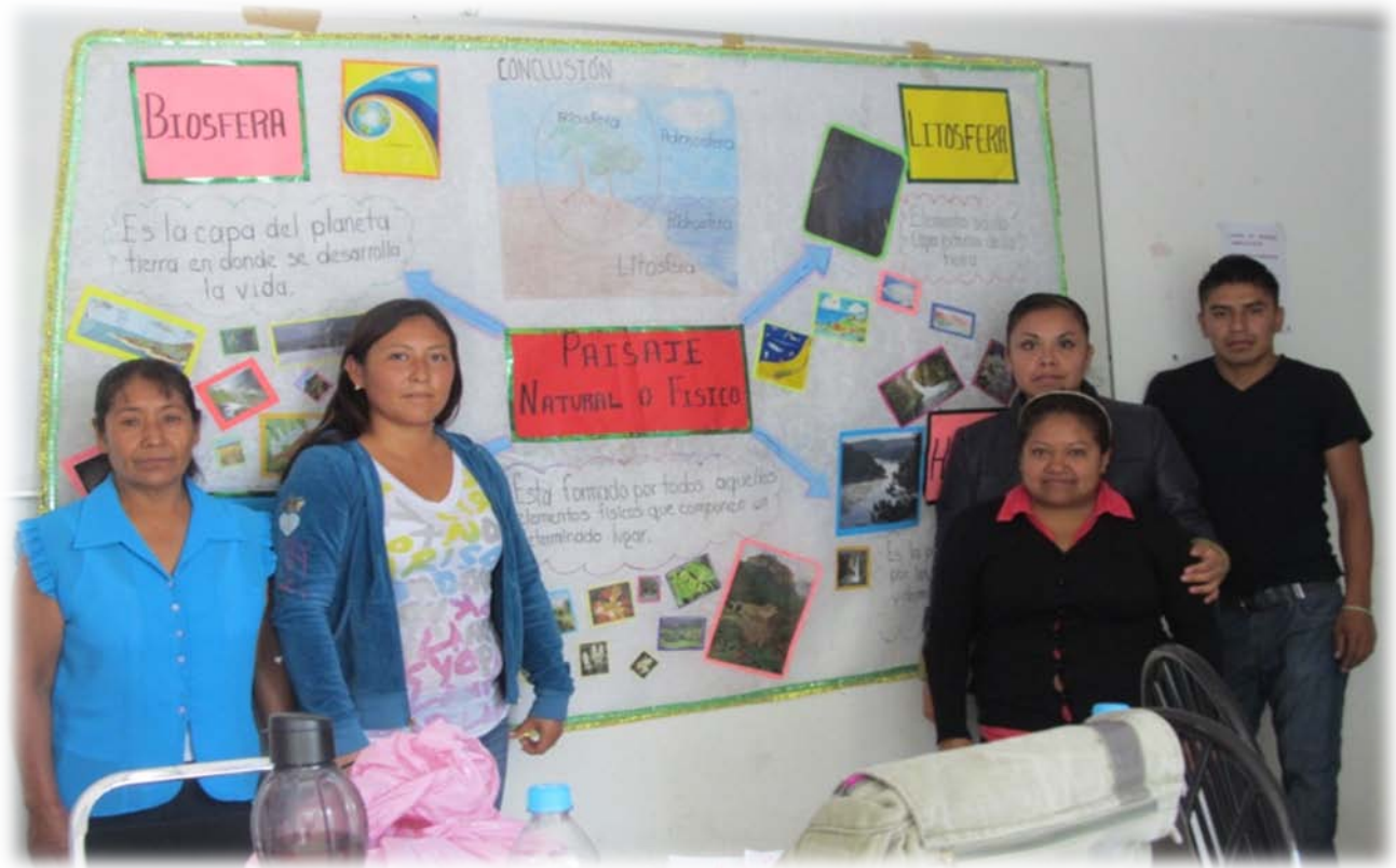
Equipo 2 de Xochicalco Febrero 14 finalizando su exposición para la materia de Geografía