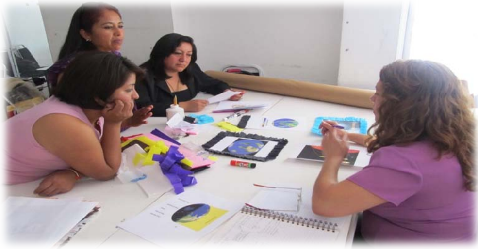
Equipo 1 de Xochicalco Febrero 14 disponiendo los elementos de su Mapa Conceptual para evaluación de la materia de Geografía.

Sin embargo, se hacen necesarias una serie de recomendaciones al momento de incorporar estas técnicas de aprendizaje a la planeación docente, en primer lugar, el docente debe modelar o ejemplificar él, o los Organizadores Gráficos de su preferencia al presentarlo por primera vez en su clase, es decir, debe explicar cómo se construye, cuáles son las partes que lo integran y para qué sirve, esto con la finalidad de que los alumnos desarrollen la habilidad de realizarlos. Posteriormente se debe proporcionar una cantidad razonable de información que le permita al estudiante seleccionar y categorizar los contenidos de su Organizador, así mismo debe permitir que se compartan los diferentes Organizadores Gráficos realizados en clase como un ejercicio de retroalimentación, ya que algunos Organizadores pueden enfatizar lo que otros no. También se hace necesario un espacio de reflexión donde el alumno diserte sobre cómo diseñar su Organizador , y por último, se evaluará tanto el proceso como el producto de la realización de los Organizadores Gráficos mediante una exposición que explique el contenido de los mismos.