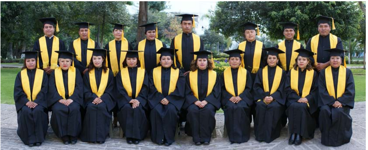
FOTO: Alumnos graduados de administración Generación Febrero 2008.