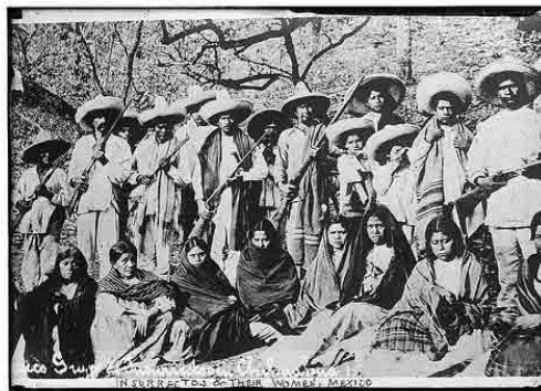
20 de Noviembre: Inicia la Revolución Mexicana

1957 - Muere Diego Rivera, genio mexicano de la pintura.