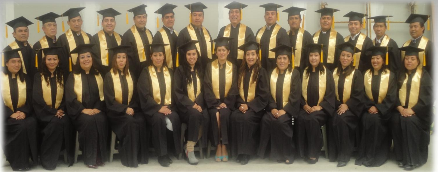
FELICIDADES A LOS GRADUADOS DE LICENCIATURA EN DERECHO GENERACIÓN AGOSTO 2010