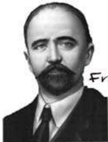
Francisco I. Madero