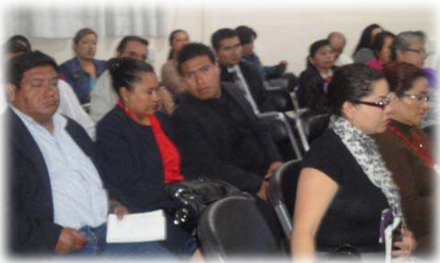
Asistentes a la plática.

Actualmente cursa la maestría en Derechos Humanos y Democracia en la facultad Latinoamericana de Ciencias Sociales; funge como enlace del Poder Judicial del Estado de Puebla ante el organismo implementador de la reforma penal, denominado Comisión Ejecutiva para la Actualización y Modernización de la Procuración y Administración de Justicia (CEAMPAJ).