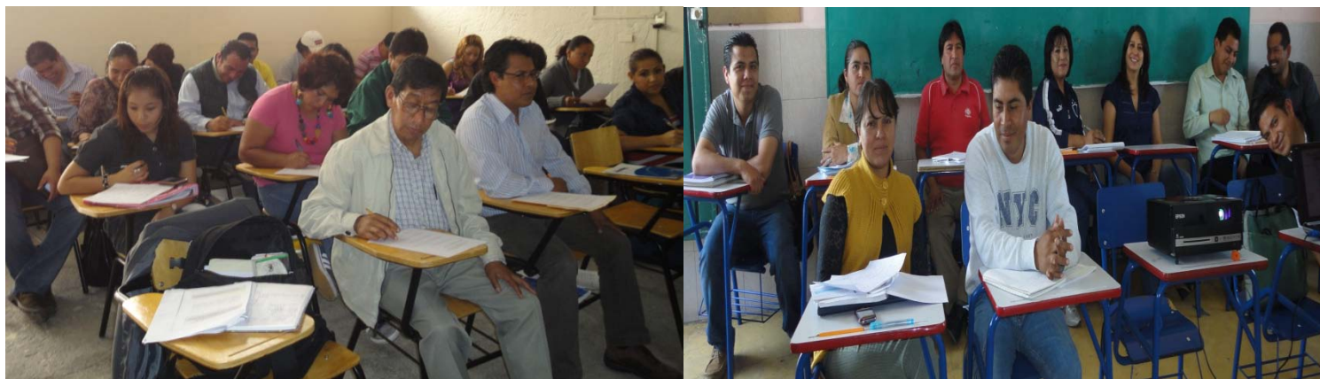
Alumnos del CEA