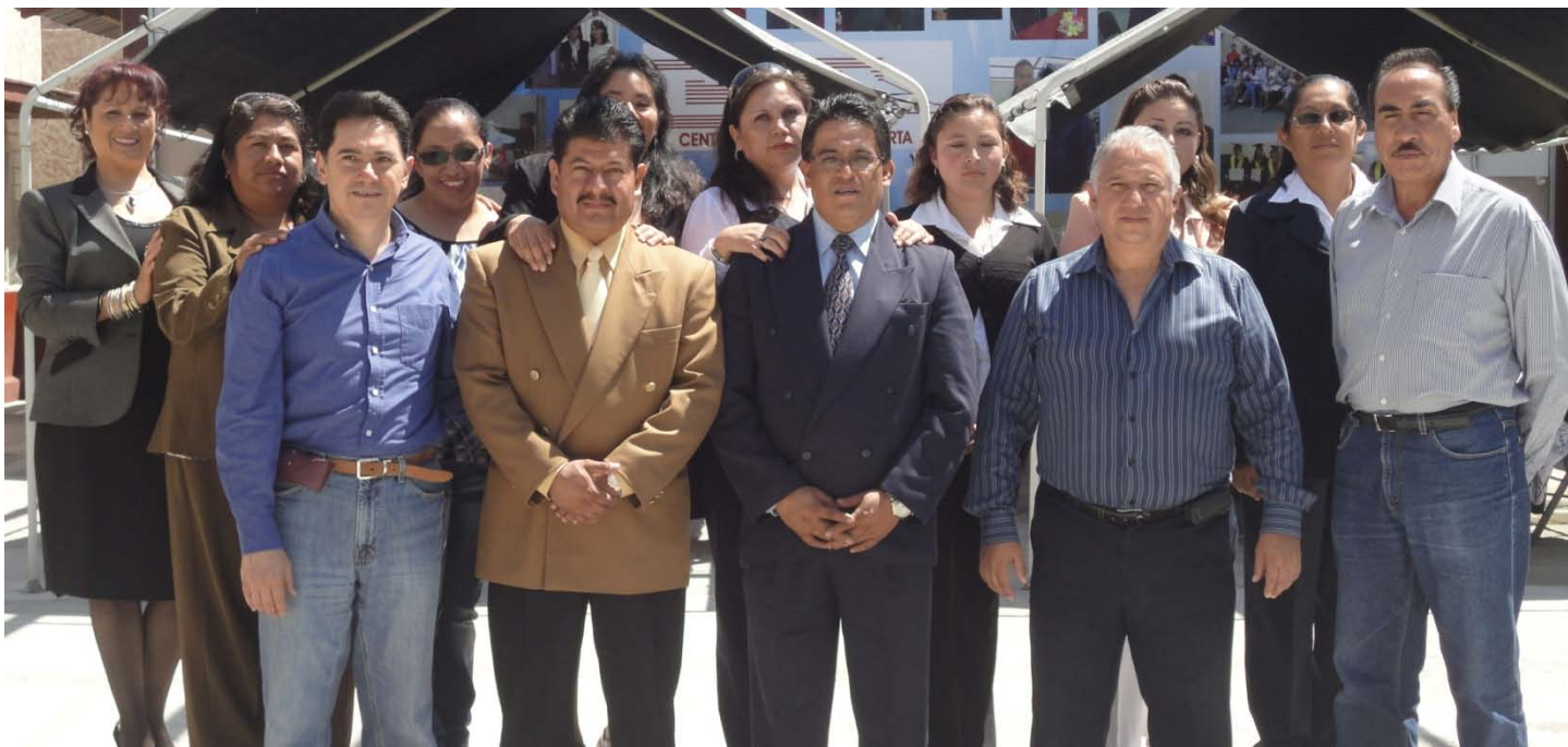
Alumnos que finalizan sus estudios en Administración. Generación Agosto 09.

“Aprender es ser un árbol en otoño que espera la primavera para nutrirse de hojas”