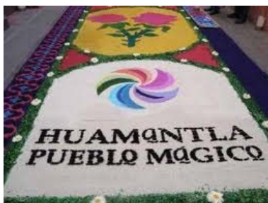
Feria de Huamantla, Tlax. del 2 al 19 de agosto. Huamantlada: sábado 18 de agosto