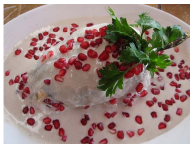
Feria del Chile en Nogada en San Andrés Calpan, Pue. 10,11,12,18 y 19 de agosto