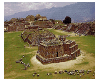
Vista de Monte Albán, Oaxaca Edificio J, Observatorio

Este pueblo se vincula a alguna de las variantes lingüísticas logo fonéticas que se refieren al término "la población de las nubes".