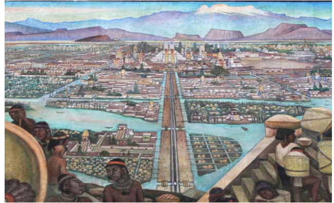
Mapa mental. México-Tenochtitlán

Analizar los motivos socioeconómicos de la conquista de México.