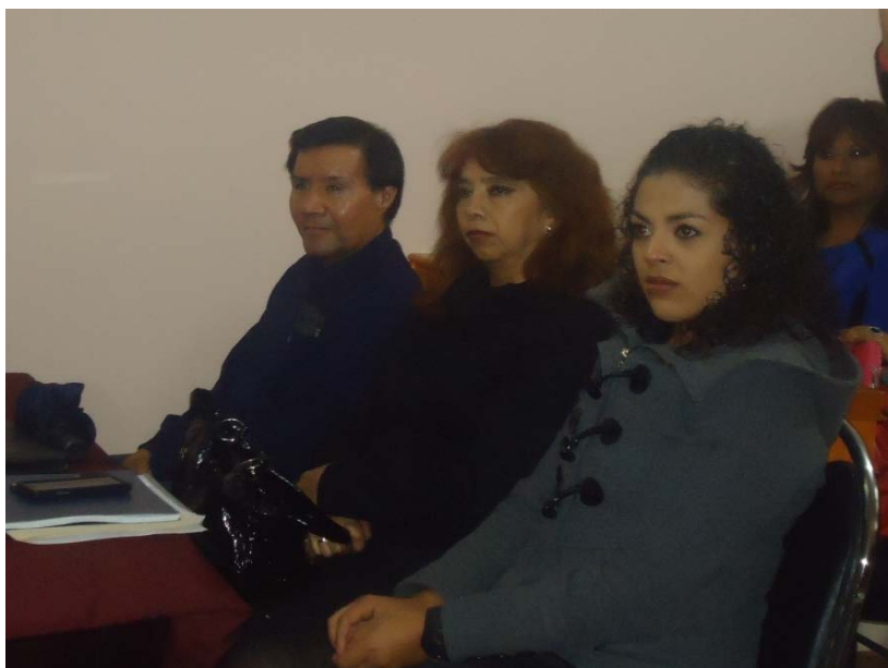
Algunos de los catedráticos que impartieron el diplomado.