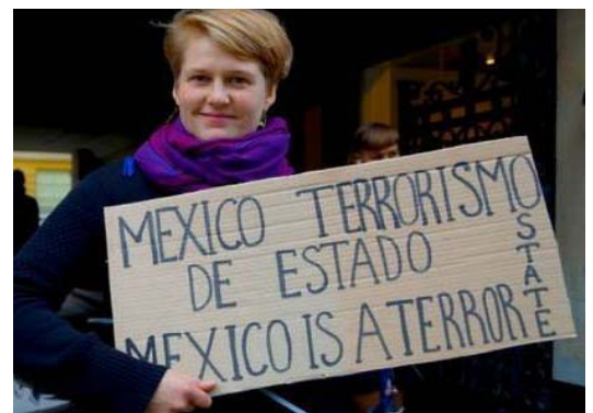
Y todo el mundo.