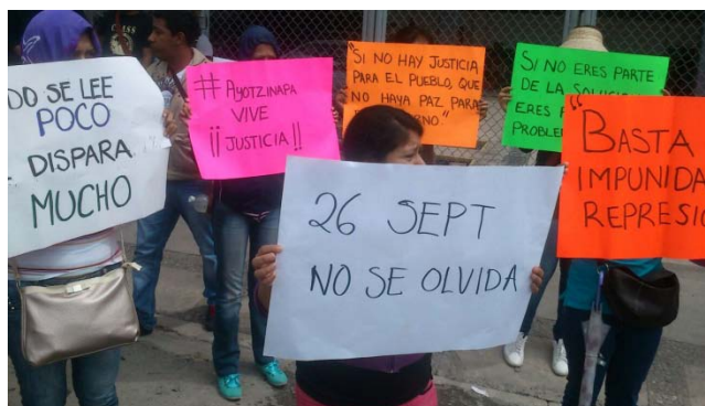
Protestas y paros en diferentes partes de México

Ante este caso, se han realizado a partir del mes de Octubre a la fecha, diversas concentraciones en todo el país y el mundo con la participación de ciudadanos mexicanos que viven en el extranjero, para exigir justicia a las autoridades ante estos ataques del día 26 de septiembre a jóvenes estudiantes mexicanos.