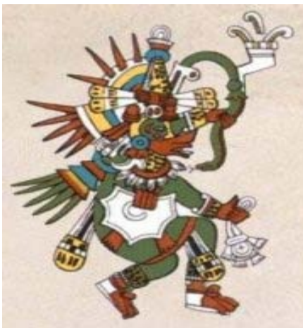
Venado Códice Borgia

Existen estudios que demuestran la interrelación que se dio entre toltecas y mayas, y la gran influencia que tuvieron los toltecas en los mayas, aunque un dato importante es que al parecer la presencia militar en Yucatán era inexistente.